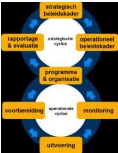
Afbeelding: BIG-8 cyclus, VNG (2015).